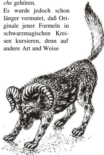
Die Widderhyäne - eine Zurbaran-Chimäre -

Es wurde jedoch schon länger vermutet, daß Originale jener Formeln in schwarzmagischen Kreisen kursieren, denn auf andere Art und Weise